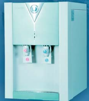
Dispenzer HD-2004 XTS

je vysoce kvalitní komplexní úpravna vody, která je vhodná svým použitím pro domácnosti a lze ji využít i pro dvě odběrná místa. AP - 08 má moderní vzhled, elektronický senzor kontroly kvality vody, vlhkostní čidlo a tři stupně čištění.